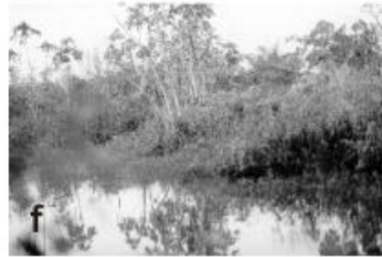
Lámina 3 a. Hyla albopunctata (Foto Diego Baldo). b. Phrynohyas imitatrix (Foto Mario Ledesma). c. Phrynohyas venulosa (Foto Diego Baldo). d. Scinax fuscovarium (Foto Pablo Aceñolaza). e. Comunidades acuáticas flotantes y bosquecillo de sauce ( Salix humboldtiana ). f. Ambiente de laguna semipermanente con Cecropia sp. (Parque Shwelm, El Dorado, Misiones)

para el litoral argentino. Esta especie de pequeño tamaño y de coloración verde, posee una gran cantidad de biliverdina en sus huesos y sangre (Barrio, 1968). En Argentina habita arroyos de la Selva Atlántica Interior de Misiones y cuenta con escasos registros (Barrio, 1968; Stetson, 2000; Baldo, 2002). Se considera “amenazada” a nivel nacional, debido a que se encuentra asociada a las selvas con Araucarias de la provincia de Misiones; hábitat actualmente fragmentado y en franco retroceso (Lavilla et al. , 2000a).