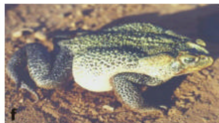
Lámina 1a. Unken reflex, Melanophryniscus atroluteus del sur de Misiones. b. Unken reflex, Melanophryniscus devincenzii del sur de Misiones. c. Vista dorsal de Melanophryniscus aff tumifrons del sur de Misiones. d. Unken reflex, Melanophryniscus cupreuscapularis de Pericón, Corrientes. (Fotos Diego Baldo). e. Bufo paracnemis (Foto Ernesto Krauczuk). f. Bufo ictericus (Foto Diego Baldo).

Paraguay (Lavilla y Ceí, 2001). Fue reportado para el norte y noroeste de Corrientes, este de Chaco y Formosa y norte de Santa Fe (Céspedes, 1999).