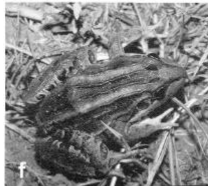
Lámina 2.a. Bufo granulosis b. Elachistocleis cf. Bicolor . c. Hyalinobatrachium uranoscopum . d. Lysapsus limaellus . e. Proceratophrys avelinoi . f. Leptodactylus ocellatus.